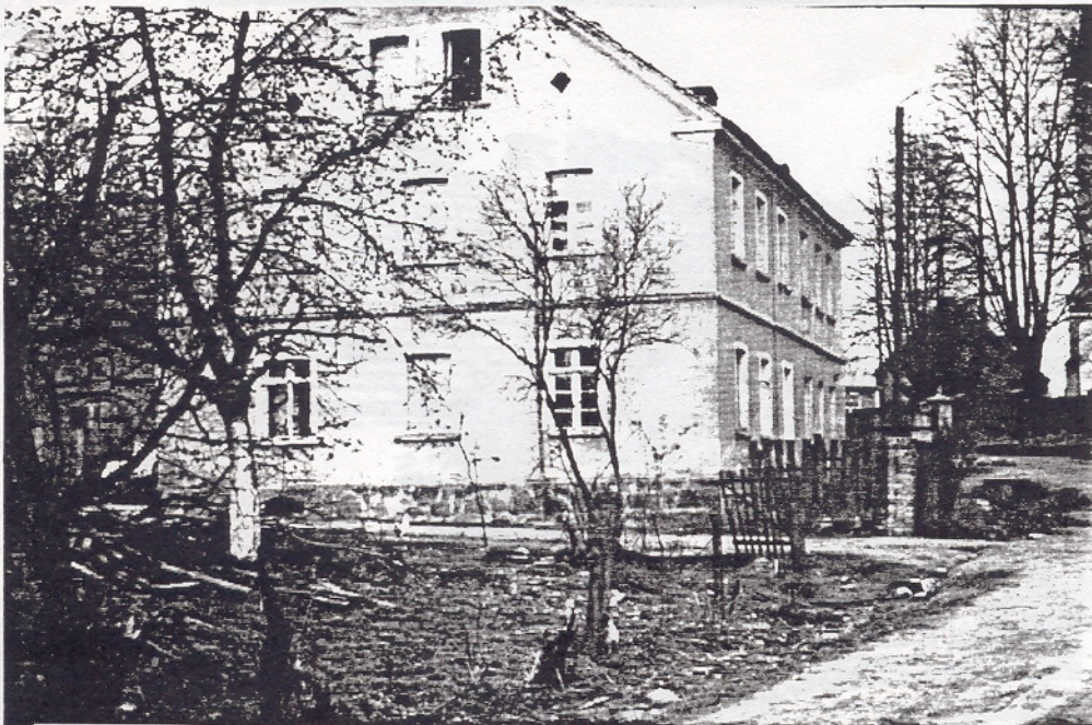
Wohnhaus des Gutsbesitzers Paul Tripke