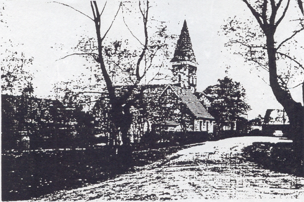
Dorfstraße am Ring (1978)