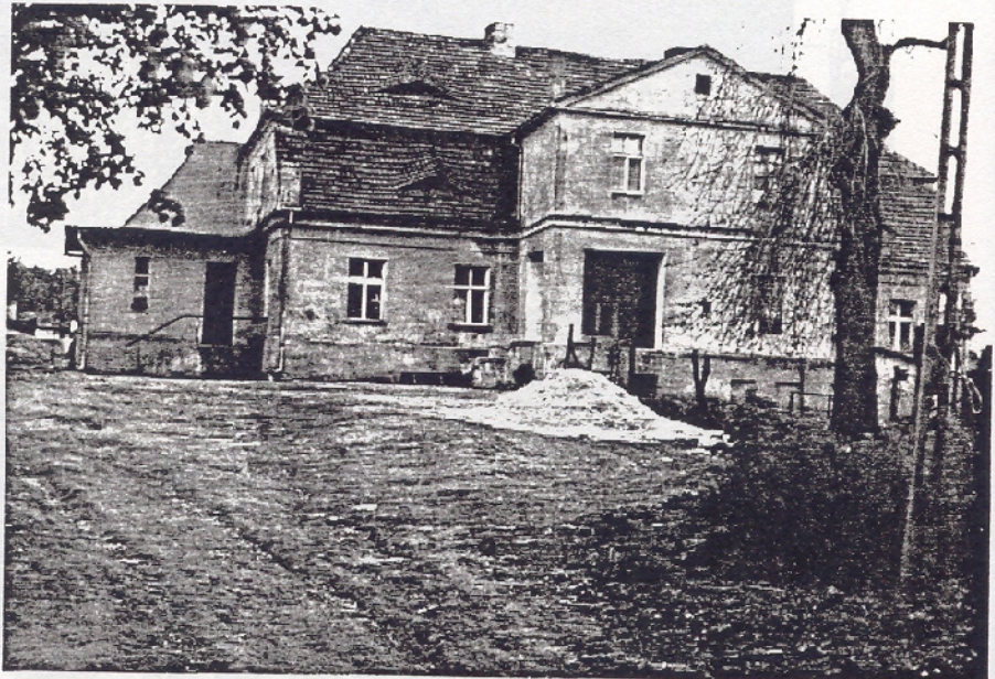
Ehemaliges Schloß in Senditz zuletzt Försterei (1980)