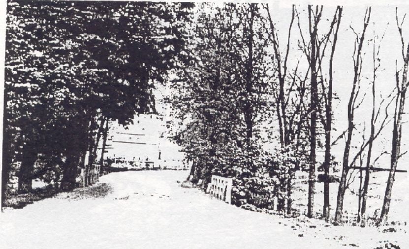
Wendebrücke in Senditz (1980)