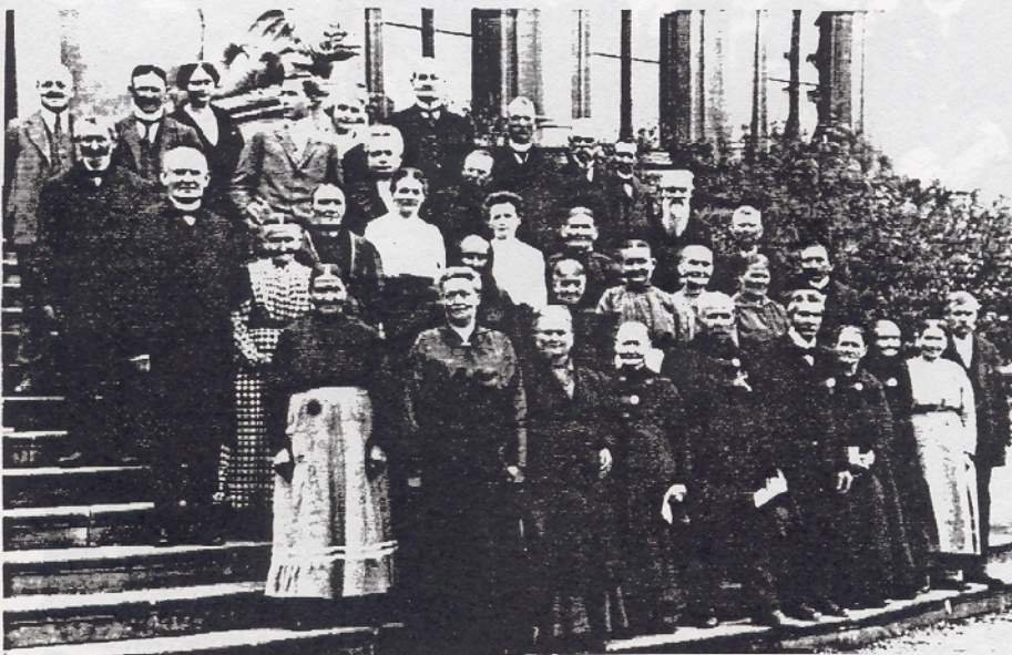
Die Grafen von Ballestrem mit Schloß- und Hofpersonal um 1927